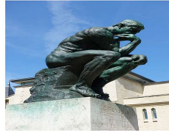
Das bist dann Du!

Eine Tasse Kaffee oder Tee, ein Stück Kuchen und dazu eine Frage, über der man ordentlich brüten kann – das bietet natürlich nur das philosophische Café!